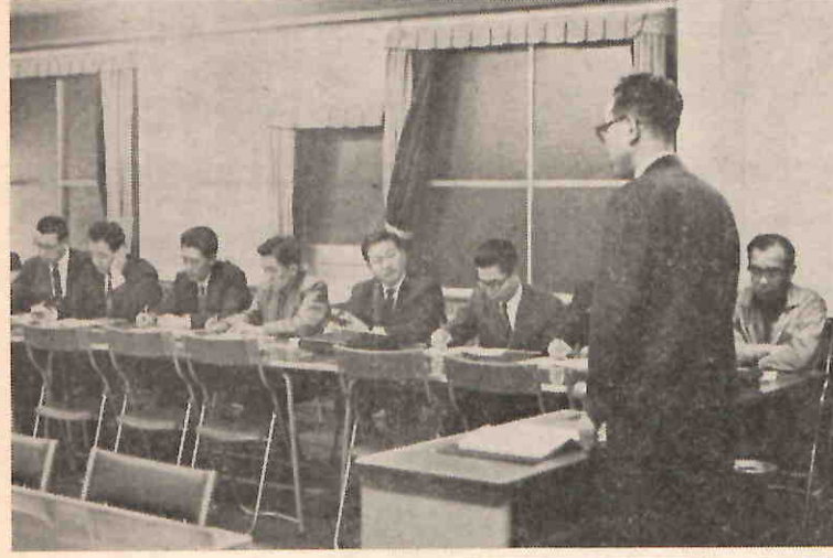
経営講習会「転機に立つ中小企業の経営戦略」

昨日、ある側面会社の再建計画というものが書いてありました。書を見たのですが、管財人が社長。私はこれを見て、この会社は駄目となって再建スタートするという目だと思いました。そもそも、接接のち、その再建計画の経営組織を確立し、権限と責任を明確方針に、「まず組織の確立、第二化したら会社が再建されるのだから責任の明確化と権限の移譲」となら、苦勞する経営者は一人もいません。しかし、経営とはそんなものではないです。経営とは何かと申しますと、決定なのです。会社をどうの方向に持って行くか、ということを決めるのが経営者なのです。