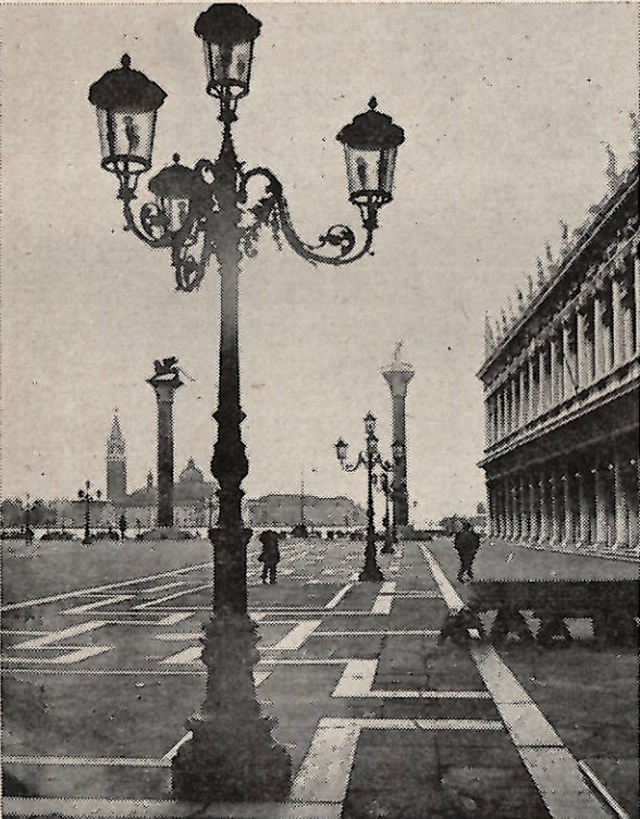
サンマルコの広場

また述べたように、解雇の自由を制限するものとして、解雇権濫用禁止の理論が提唱されている。解雇権も民法の適用を受けるべき権利であるから、そうした民法第一条の規定の適用をうけなければならぬといふまでもない。労働法はこれについてならぬ修正を行っていない。したがって、権利濫用禁止の理論による解雇の自由の制限は、解雇権に特殊なことでなく、ただ、解雇権は必然的に被解雇者の生活をおびやかすこととなるから、解雇権に対しては濫用禁止の理論がおのずから一層嚴格に適用されざるを得ないわけである。