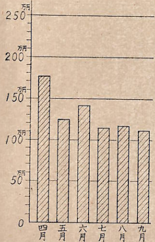
昭和三十七年度共同購入取扱高

り、一応この件について組合員の意向をきくため、アンケートをとることに決定した。 九月六日 労務対策セミナー 九月七日 労務対策セミナー 九月八日 労務対策セミナー 九月十三日 下請代金支払遅延防止法改正説明会開催について通知 九月十五日 麻雀大会 九月二十日 下請代金遅延防止法改正説明会(協賛) 九月二十二日 囲碁大会 ⑤組合員工場設備近代化資金について 設備近代化資金について、無償利用等を考慮してはとの提案がある