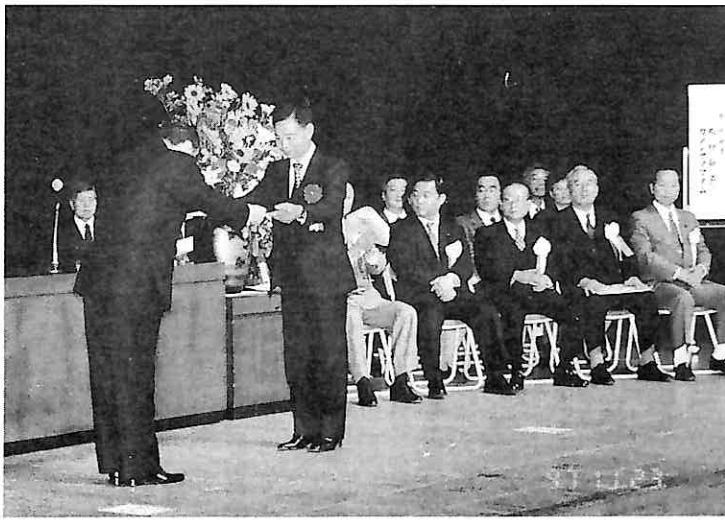
永年勤続従業員表彰

(於ときわ) 十二月三日 忘年会(木鶏会・於山王クラブ) 十二月九日 青年部忘年会(木鶏会・於風車) 以上