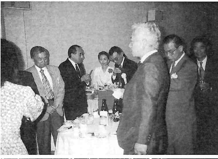
工場見学 本間美術館続きの本間邸にて